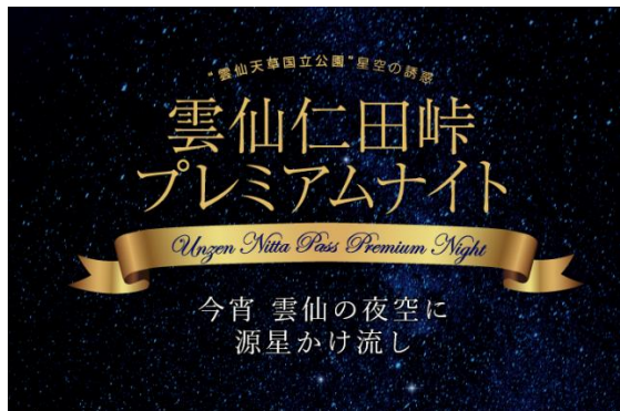
雲仙仁田峠プレミアムナイト