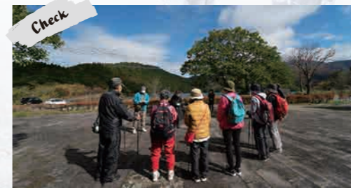
POINT インストラクターレクチャー

島原半島ユネスコ世界ジオパークの地質・地形や地域の自然・歴史・文化などについて詳しく知る専門のガイドが皆様に各ポイントをご説明します。