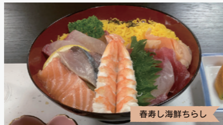
春寿し海鮮ちらし