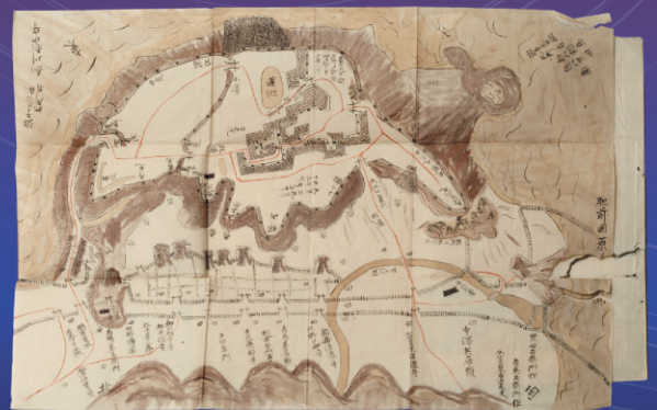
『肥前島原記』天 (西南学院大学博物館所蔵)